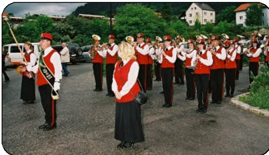
Der Musikverein Pottschach kommt noch trocken in die Barbarahalle.

Vom 3. bis 5. Juni stand unsere Gemeinde im Zentrum der Blasmusik. Freitag Abend war Start mit einem fulminanten Festkonzert unter dem Motto "Blasmusik im Bigbandsound". Das Blasorchester ergänzt mit E-Piano, Gitarre, E-Bass, toller Licht- und Soundtechnik und vielen Gesangssolisten konnte fast 400 Besucher zu Begeisterungstürmen hinreißen.